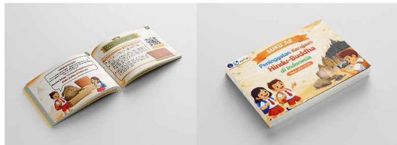
Gambar 3. Hasil Buku AR Secara Fisik dan Digital

Tahap pengujian ( testing ) dilakukan setelah proses assembly selesai dengan tujuan memastikan seluruh fitur aplikasi SejARah berjalan sesuai perencanaan serta meminimalkan kesalahan sebelum digunakan oleh pengguna. Setelah proses pengembangan yang ditunjukkan pada Gambar 3 selanjutnya dilakukan proses pengujian. Pengujian meliputi uji blackbox dan uji validitas oleh ahli. Uji blackbox dilakukan untuk menilai kesesuaian fungsi aplikasi berdasarkan input, proses, dan output tanpa melihat kode program, yang dilaksanakan pada 26 Februari 2026 menggunakan perangkat smartphone Xiaomi 12 berbasis Android 14 dengan instrumen 41 butir penilaian. Hasil pengujian menunjukkan bahwa seluruh aspek memperoleh hasil “sesuai” atau mencapai tingkat keberhasilan 100%, sehingga semua fungsi seperti navigasi, pemindaian marker, pemunculan objek tiga dimensi, audio, dan kuis berjalan dengan baik. Selanjutnya, dilakukan uji ahli isi dan uji ahli media. Hasil uji disajikan pada Tabel 3 dan Tabel 4.