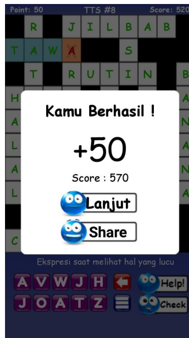
Gambar 4. Form Tampilan Score

Tampilan score merupakan hasil akhir dari permainan Teka Teki Silang karena pemain dapat menyelesaikan menyusun huruf menjadi kata yang benar. Berikut tampilan score pada permainan Teka Teki Silang :