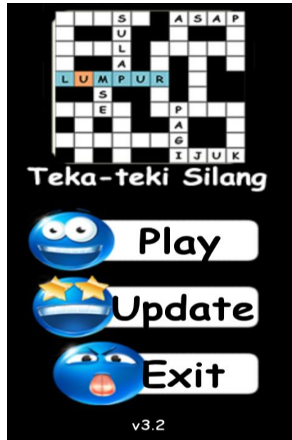
Gambar 1. Form Menu Utama

Form menu utama merupakan media penghubung pengguna aplikasi dengan aplikasi permainan Teka Teki Silang. Pada menu utama ini terdapat 3 sub menu yakni Play, Update, dan Exit. Menu utama pada aplikasi permainan Teka Teki Silang pada penelitian ini seperti gambar berikut :