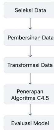
Gambar 1. Flowchart Tahapan Penelitian KDD