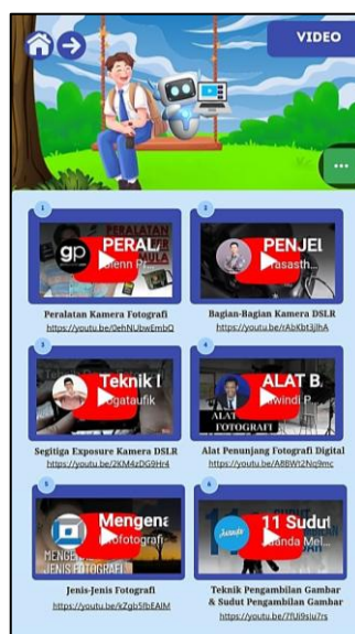
Gambar 3. Menu Video