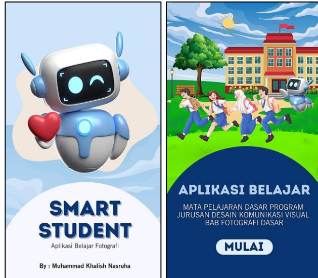
Gambar 1. Tampilan awal aplikasi media pembelajaran