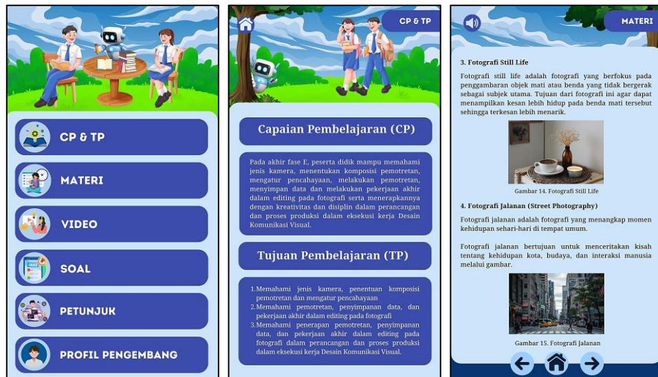
Gambar 2. Menu Utama, capaian pembelajaran dan halaman materi