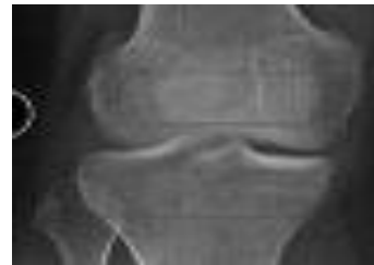
Gambar 2. Citra awal (a) dan citra hasil proses (b)