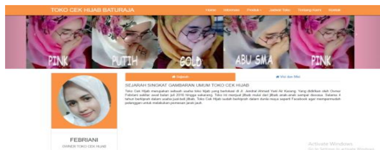
Gambar 7. Tampilan Halaman sejarah, visi dan misi

Halaman selanjutnya berisi tentang sejarah, visi dan misi, pada toko cek hijab. Adapaun tampilan halaman tersebut sebagai berikut: