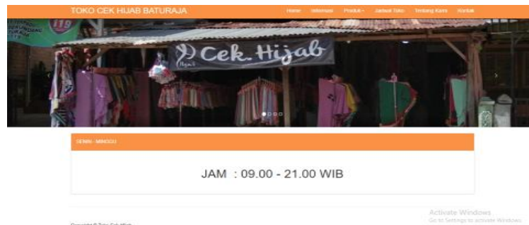
Gambar 6. Tampilan halaman jadwal toko

Halaman berikutnya menampilkan jadwal operasional toko. Jam operasional dimulai pukul 09.00 sampai dengan pukul 21.00, melayani tujuh hari penuh tanpa jam libur. Berikut tampilan gambar yang terlihat.