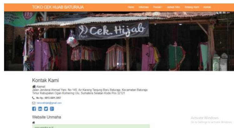
Gambar 8. Tampilan halaman kontak

Halaman terakhir adalah informasi kontak toko yang berisikan alamat, nomor telepon, alamat dan e-mail toko cek hijab. Tampilan halaman tersebut sebagai berikut: