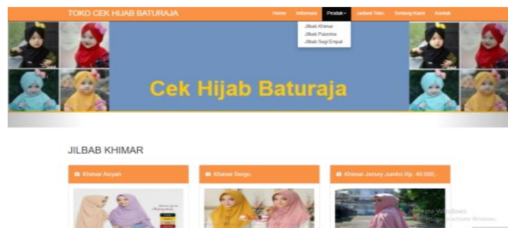
Gambar 3. Tampilan halaman Produk Jilbab Khimar

Halaman berikutnya adalah halaman yang menampilkan Produk. Produk yang ditampilkan yakni aneka jilbab dengan berbagai model dan ukuran. Ada tiga model yang ditawarkan pada halaman ini yaitu jilbab khimar, pashmina, dan segi empat. Tampilan dari halaman tersebut dapat terlihat pada gambar berikut: