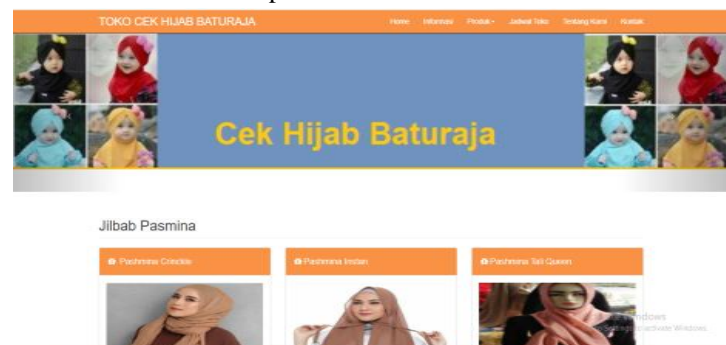
Gambar 4. Tampilan halaman produk jilbab pashmina