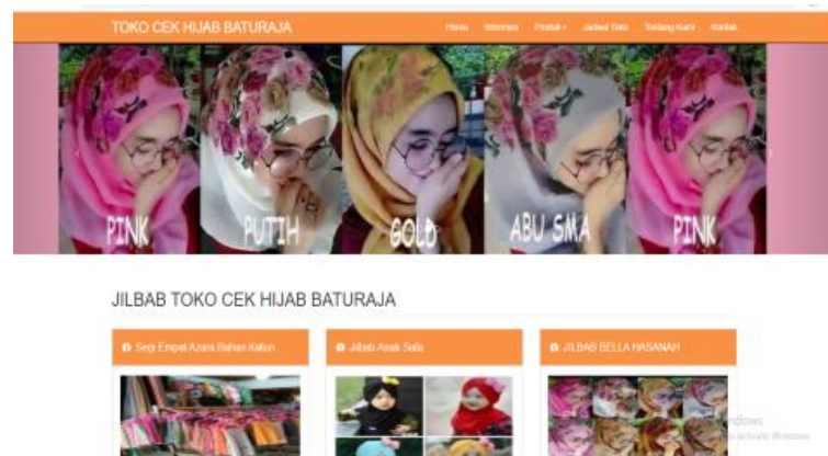
Gambar 1. Tampilan halaman home

Situs website ini berisi tentang Home, Informasi, Produk, jadwal Toko, tentang sejarah, visi dan misi, dan kontak pada Toko Cek Hijab. Di dalam website ini terdiri dari beberapa halaman web yang saling berhubungan antara satu dengan yang lain. Halaman pertama yang akan muncul adalah halaman Home. Halaman Home, merupakan halaman pertama kali pengunjung mengakses website Toko Cek Hijab, maka halaman web yang akan tampil adalah halaman index yang merupakan halaman utama yang berisi gambar ruangan dan artikel di sebelah kanan Berikut ini adalah halaman utama dari website Toko Cek Hijab