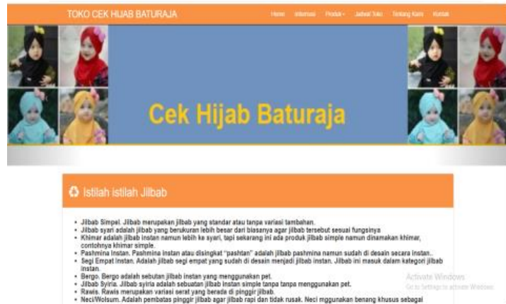
Gambar 2. Tampilan halaman informasi

Selanjutnya adalah halaman informasi dimana berisi tentang penjelasan tentang istilah jilbab dan tiga jenis pengertian jilbab. Tampilannya terlihat ada gambar 2 berikut ini: