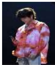
Gambar 1. Citra Asli RGB

Sebelum melakukan deteksi tepi pada citra dengan menggunakan metode sobel , maka harus ditentukan terlebih dahulu resolusi, warna dan format dari citra tersebut. Citra yang akan dideteksi tepinya adalah citra yang memiliki resolusi 218x345 dengan citra color image atau RGB ( Red, green, blue ) dan format penyimpanan bitmap (*.bmp). Citra yang digunakan dapat dilihat pada gambar dibawah ini.