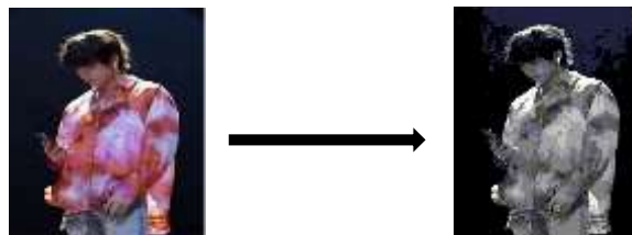
Gambar 2. Citra RGB dan Citra grayscale

>> img=imread('c:\citra\skripsi\v.bmp'); >> gray=uint8(0.2989*double(img(:,:,1))+... 0.5870*double(img(:,:,2))+... 0.1131*double(img(:,:,3))); >> imshow(gray);