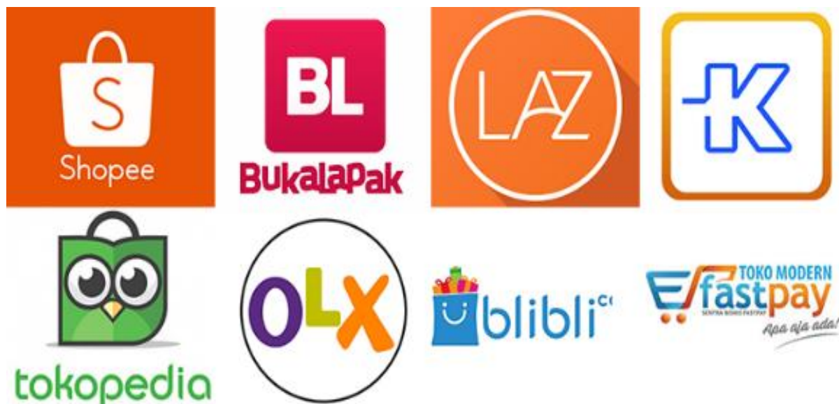
Gambar 2. Contoh Aplikasi E-commerce di Indonesia

Aplikasi kewirausahaan menjadi bagian penting dalam produktivitas UMKM. Aplikasi kewirausahaan merujuk pada beragam perangkat lunak dan alat yang digunakan oleh wirausahawan dan pemilik usaha untuk mengelola, mempromosikan, dan mengembangkan bisnis mereka. Menurut Sumaili (2018), aplikasi kewirausahaan adalah seperangkat perangkat lunak dan teknologi yang dirancang khusus untuk membantu pemilik usaha dalam mengelola aspek-aspek beragam dari operasional bisnis mereka, mulai dari akuntansi hingga pemasaran. Berikutnya adalah contoh dari aplikasi e-commerce di Indonesia yang sering digunakan oleh pelaku UMKM yaitu: