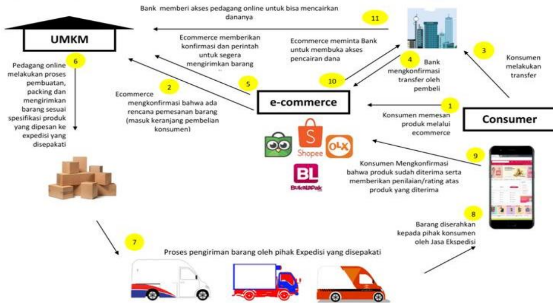
Gambar 3. Model Transaksi di E-commerce

Dalam proses perdagangan elektronik, model transaksi e-commerce mengacu pada serangkaian tahapan yang harus dilalui dari awal hingga akhir ketika terjadi transaksi antara pembeli dan penjual melalui platform online . Berdasarkan gambar 3, beberapa tahapan dalam pembelian melalui e-commerce diantaranya 1) Konsumen memesan produk melalui e-commerce ; 2) E-commerce mengkonfirmasi bahwa ada rencana pemesanan barang (masuk keranjang pembelian konsumen); 3) Konsumen melakukan transfer; 4) Bank mengkonfirmasi transfer oleh pembeli; 5) E-commerce memberikan konfirmasi dan perintah untuk segera mengirimkan barang yang dipesan; 6) Pedagang online melakukan proses Pengiriman; 7) Proses pengiriman barang oleh pihak ekspedisi yang disepakati; 8) Barang diserahkan kepada pihak konsumen oleh jasa ekspedisi; 9) Konsumen mengkonfirmasi bahwa produk sudah diterima serta memberikan penilaian/ rating ; 10) E-commerce meminta bank untuk membuka akses pencairan dana; 11) Bank memberi akses pedagang online untuk bisa mencairkan dananya.