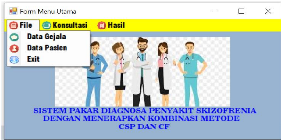
Gambar 4. Form Menu Utama

Form ini merupakan form utama dari perangkat lunak yang menghubungkan semua form yang terdapat pada perangkat lunak. Rancangan form ini dapat dilihat pada gambar 3.