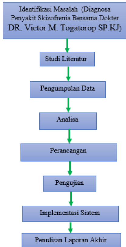
Gambar 1. Kerangka Penelitian

Mendiagnosa Penyakit Skizofrenia dengan kombinasi metode Constraint Satisfaction Problem (CSP) dan Certainty Factor (CF). Adapun tahapan-tahapan yang dilakukan dapat dilihat pada kerangka kerja berikut ini.