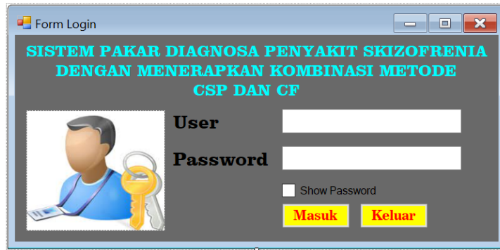
Gambar 2. Form Login

Form ini merupakan tempat pengisian data user untuk login ke dalam sistem. Rancangan form ini dapat dilihat pada gambar 2