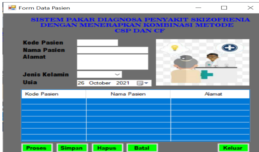
Gambar 7. Form Data Pasien