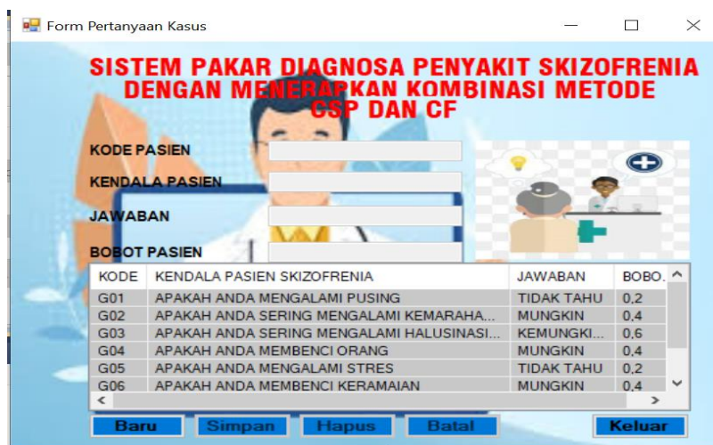
Gambar 8. Form Data Pertanyaan

Form ini merupakan tempat pertanyaan data pasien yang akan melakukan diagnosa penyakit. Rancangan form ini dapat dilihat pada gambar 8.