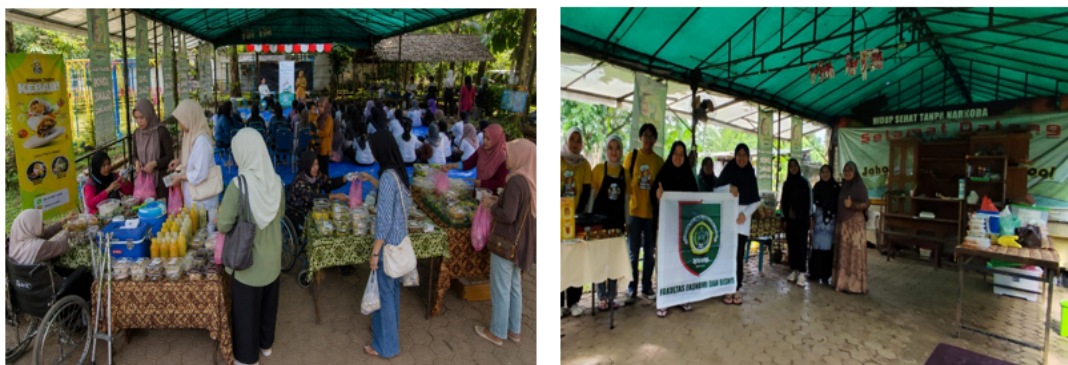
Gambar 2. Pelaksanaan Pelatihan dan Pendampingan bagi Pelaku Usaha Penyandang Disabilitas Daksa

Pelaksanaan kegiatan yang melibatkan peserta secara aktif dalam proses pelatihan, diskusi, dan pendampingan ditunjukkan pada Gambar 2. Dokumentasi tersebut menggambarkan interaksi antara tim pelaksana dan peserta selama proses penyampaian materi dan pendampingan. Keterlibatan peserta dalam kegiatan menunjukkan bahwa metode partisipatif dapat diterapkan pada kelompok sasaran dengan tingkat pengalaman dan kemampuan digital yang beragam.