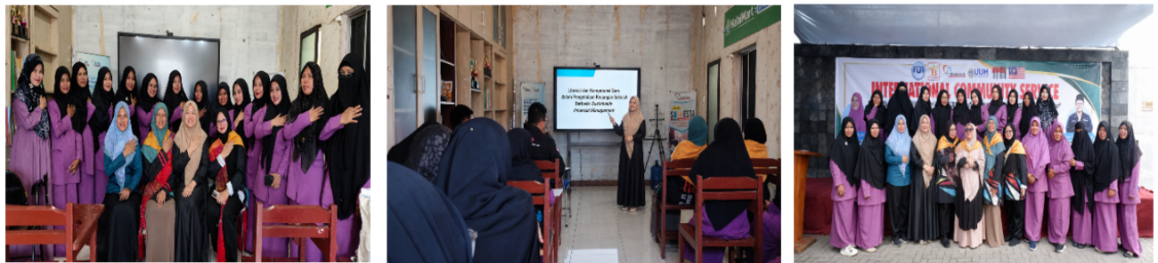
Gambar 3. Partisipasi Peserta dalam Pelatihan dan Pendampingan Pengelolaan Keuangan

Dokumentasi partisipasi mitra selama pelatihan dan pendampingan disajikan pada Gambar 3.