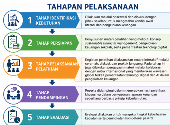
Gambar 1. Tahapan Pelaksanaan Kegiatan Pengabdian kepada Masyarakat

Prosedur kerja kegiatan disusun secara sistematis melalui lima tahapan, yaitu identifikasi kebutuhan, persiapan, pelaksanaan pelatihan, pendampingan, dan evaluasi. Alur pelaksanaan kegiatan disajikan pada Gambar 1.