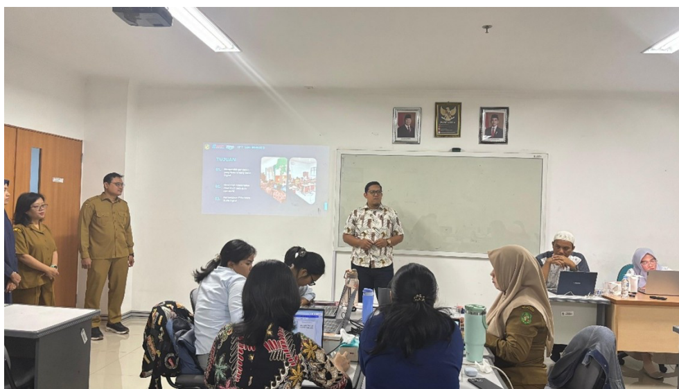
Gambar 3. Kegiatan peer teaching pada tahap On-the-Job Training (OJT) sebagai sarana refleksi dan penguatan praktik pembelajaran koding dan kecerdasan artifisial

Tema ketiga: Variasi adopsi yang berkaitan dengan kondisi struktural. Analisis data secara konsisten menemukan bahwa tingkat adopsi yang tinggi terkait dengan: (1) dukungan aktif kepala sekolah yang mengalokasikan waktu ekstra untuk persiapan dan berpartisipasi dalam beberapa sesi observasi; (2) ketersediaan perangkat yang memadai (minimal satu perangkat per dua siswa); dan (3) koneksi internet yang stabil. Sekolah tanpa ketiga faktor ini menunjukkan adopsi yang stagnan bahkan parsial, dengan beberapa guru melaporkan ketidakmampuan untuk menerapkan aktivitas berbasis platform sama sekali.