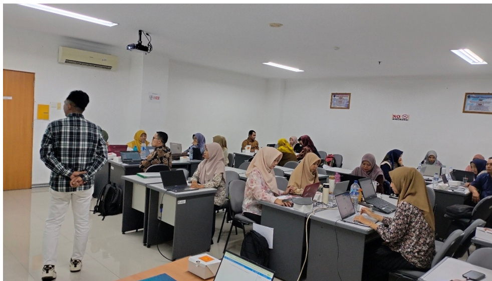
Gambar 4. Presentasi dan refleksi hasil implementasi pembelajaran pada tahap In Service Training 2 (IN-2)

Pada tingkat komunitas, pembentukan komunitas praktik digital dengan 168 anggota aktif merupakan luaran yang melampaui target awal program. Komunitas ini berfungsi tidak hanya sebagai forum berbagi materi, tetapi juga sebagai sumber dukungan sosial yang mengurangi perasaan isolasi yang sering dirasakan guru inovatif di sekolah dengan kultur konservatif. Vijfeijken, Raes, & Dochy (2024) menekankan bahwa komunitas praktik yang terbentuk secara organik dari program PD terbukti lebih berkelanjutan daripada komunitas yang dibentuk secara formal oleh institusi. Kondisi ini menjadi modal sosial penting untuk menjamin keberlanjutan adopsi praktik koding di luar durasi program formal.