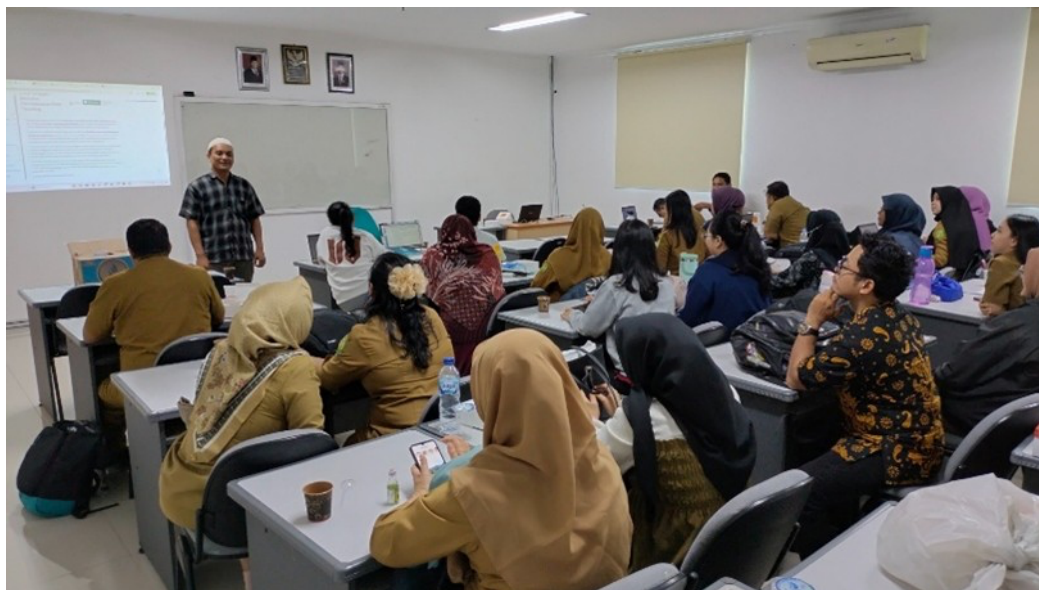
Gambar 2. Peserta pelatihan menerima pembekalan materi pada fase In Service Training 1 (IN-1)