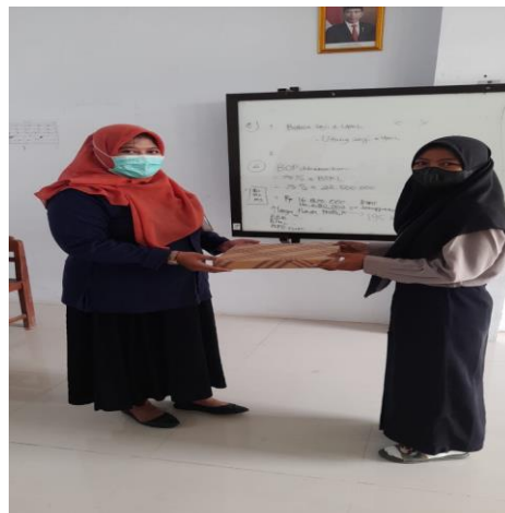
Gambar 5. Pemberian doorprize kepada siswa yang bisa menjawab pertanyaan