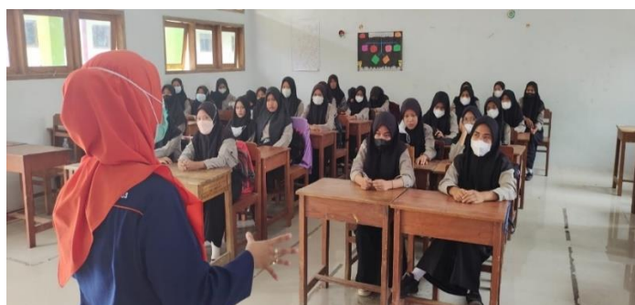
Gambar 2. Penjelasan tentang persiapan Pranikah sebagai upaya Mencegah Stunting

Berikut gambar dokumentasi dari kegiatan pengabdian yang dilakukan.