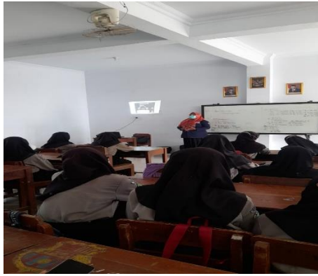
Gambar 3. Penjelasan tentang gizi remaja