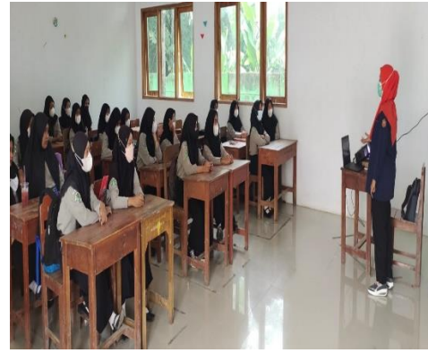
Gambar 4. penjelasan tentang reproduksi remaja