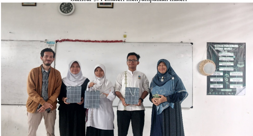
Gambar 4. Pemateri bersama perwakilan siswa-siswi mitra sekolah yang aktif selama kegiatan sesi tanya jawab.