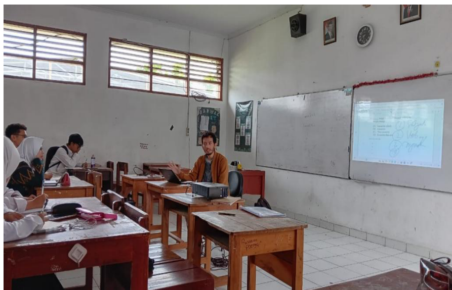
Gambar 2. Pemateri membuka kegiatan

Metode yang digunakan pada kegiatan ini mencakup ceramah interaktif, diskusi kelompok, latihan soal, serta pembahasan bersama. Pendekatan ini sesuai dengan teori pembelajaran bahasa yang menekankan pentingnya keterlibatan aktif peserta didik pada proses pembelajaran (Brown, 2004). Selain itu, penerapan latihan intensif ini juga mendukung peningkatan kemampuan secara bertahap melalui pengalaman langsung (Kolb, 1984).