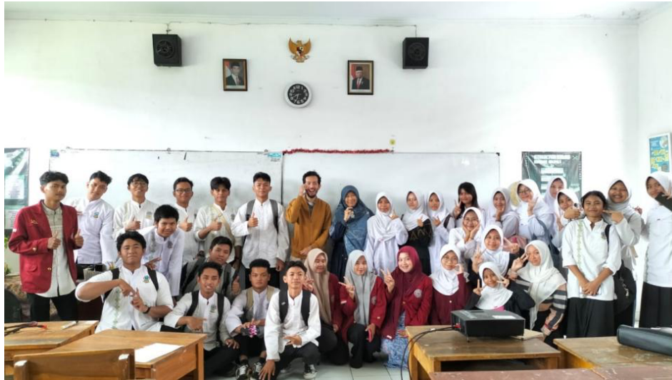
Gambar 6. Foto bersama