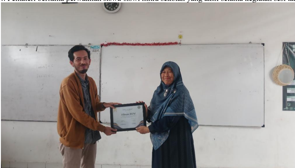
Gambar 5. Penyerahan sertifikat