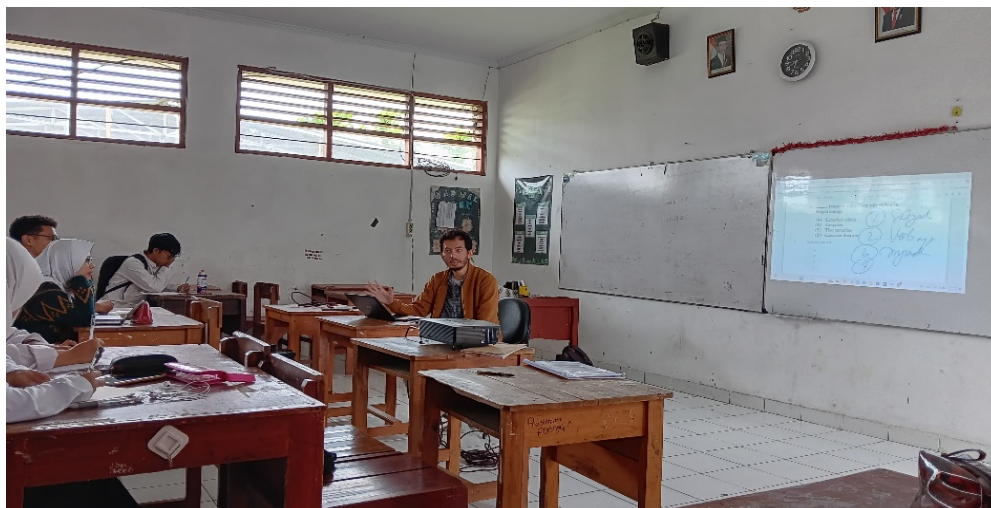
Gambar 3. Pemateri menyampaikan materi