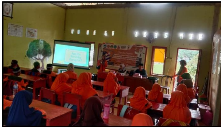
Gambar 2. Pelaksanaan Penyuluhan di MI Nurul Ilmi Hidayatullah

Pelaksanaan kegiatan di MI Nurul Ilmi Hidayatullah menunjukkan antusiasme yang tinggi dari para siswa. Para peserta terlihat aktif mengikuti jalannya kegiatan, terutama pada saat sesi diskusi dan tanya jawab. Interaksi antara fasilitator dan siswa berlangsung secara dinamis sehingga menciptakan suasana pembelajaran yang komunikatif dan partisipatif. Dokumentasi kegiatan di sekolah tersebut dapat dilihat pada Gambar 2.