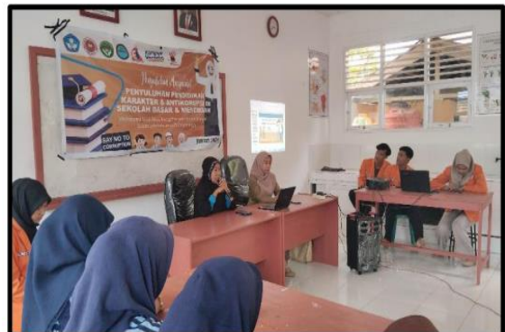
Gambar 3. Pelaksanaan Penyuluhan di SDN 2 Tampiala Gambar 4. Pelaksanaan Penyuluhan di SMPN 1 Damsel

Gambar 3 memperlihatkan kegiatan penyuluhan yang dilaksanakan di lingkungan SD Negeri 2 Tampiala bersama para siswa dan guru pendamping. Kegiatan ini tidak hanya menjadi sarana pembelajaran bagi siswa, tetapi juga menjadi momentum kolaborasi antara mahasiswa, dosen, dan pihak sekolah dalam menanamkan nilai-nilai karakter kepada peserta didik. Kehadiran guru dalam kegiatan ini turut memberikan dukungan terhadap implementasi pendidikan karakter di lingkungan sekolah. Pelaksanaan kegiatan pada hari ketiga dilaksanakan di SMP Negeri 1 Dampal Selatan (Gambar 4)