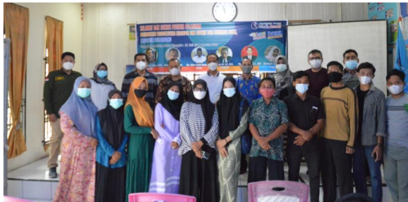
Gambar 3. Suasana pelatihan

Dalam TOT digital printing juga membahas Kelebihan Digital Printing :