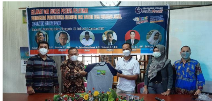
Gambar 4. Serah terima baju digital printing hasil pengabdian kepada mitra

TOT Marketing online fokus dalam memberikan informasi mengenai pemanfaatan pemasaran daring bagi dunia UKM, pengenalan mengenai media sosial yang bisa digunakan untuk iklan seperti Instagram dan Facebook serta Shopee. Kemudian memaparkan cara mendaftar akun di Facebook dan shofee, membuat halaman facebook, mendaftar akun instagram, mendaftar ke shopee serta mengenalkan bagaimana cara beriklan di kedua media sosial tersebut dan mengenalkan fitur-fitur yang dimiliki facebook dan instagram serta shopee Dampak dari Pengabdian masyarakat bagi mitra dapat dilihat pada gambar dibawah ini: