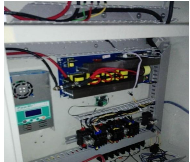
Gambar 4. Sistem kontrol dengan MPPT dan Inverter

PLTPH menggunakan system kontrol MPPT yang menerima daya dari generator yang kemudian disimpan di battery dengan system voltase 48 V DC, dari battery voltase ditingkatkan menjadi 220 AC yang bisa dipakai untuk kebutuhan masjid baik untuk penerangan maupun untuk pengeras suara, Adapun system kontrol dapat dilihat pada Gambar 4. Adapun tempat penyimpanan daya menggunakan battery Gel VRLA 12V 100AH dengan voltase balancer (penyeimbang) dapat dilihat pada Gambar 5.