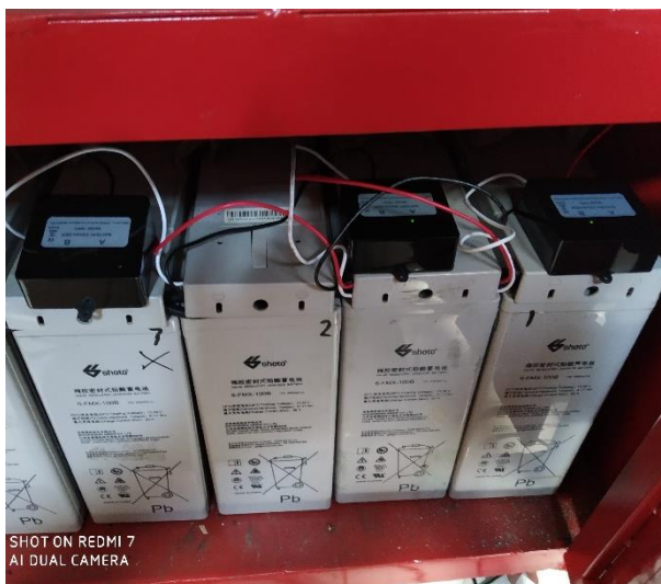
Gambar 5. Battery VRLA dengan penyeimbang tegangan

PLTPH menggunakan system kontrol MPPT yang menerima daya dari generator yang kemudian disimpan di battery dengan system voltase 48 V DC, dari battery voltase ditingkatkan menjadi 220 AC yang bisa dipakai untuk kebutuhan masjid baik untuk penerangan maupun untuk pengeras suara, Adapun system kontrol dapat dilihat pada Gambar 4. Adapun tempat penyimpanan daya menggunakan battery Gel VRLA 12V 100AH dengan voltase balancer (penyeimbang) dapat dilihat pada Gambar 5.