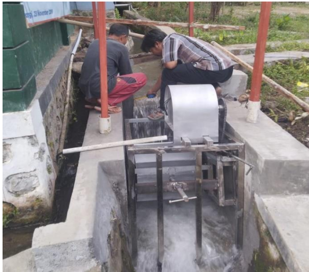
Gambar 3. Pembangkit Listrik Tenaga Piko Hydro

Guna menambah nilai manfaat dari aliran irigasi tersebut, dari hasil diskusi dan identifikasi permasalahan dan potensinya bersama mitra, maka kebutuhan mitra adalah Pembangkit Listrik Tenaga Piko Hydro (PLTPH) seperti ditunjukkan pada Gambar 3