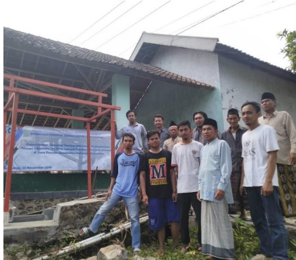
Gambar 7. Serah Terima Alat PLTPH

diserahkan ke Takmir Masjid sebagai Mitra Desiminasi Produk Teknologi ke Masyarakat (DPTM). Proses serahterima dapat dilihat pada Gambar 7.