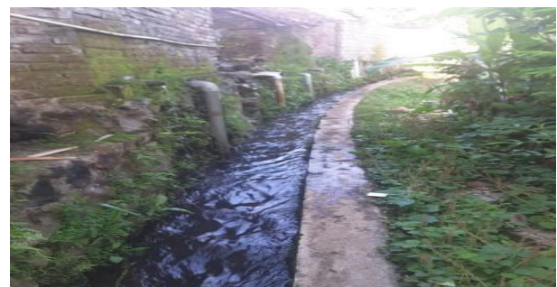
Gambar 2. Saluran irigasi yang dijadikan saluran pembuangan masyarakat