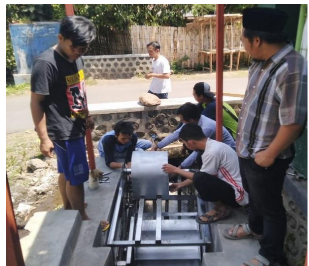
Gambar 6. Ujicoba Alat

Langkah berikutnya setelah pembangkit listrik selesai dibuat adalah uji fungsi dari alat sebelum kegiatan serah terima dilakukan. Uji fungsi dari alat yang dilakukan meliputi alat mekanik yang berupa turbin dan juga fungsi dari kelistrikan saat disambungkan dengan beban. Adapun tujuan dari uji pembangkit listrik ini adalah untuk mengetahui dan memastikan bahwa alat yang telah dibuat dapat berfungsi dengan baik sebagaimana mestinya yaitu menghasilkan listrik guna kebutuhan Masjid Baitulmuttaqin. Proses ujicoba alat bisa dilihat pada Gambar 6.