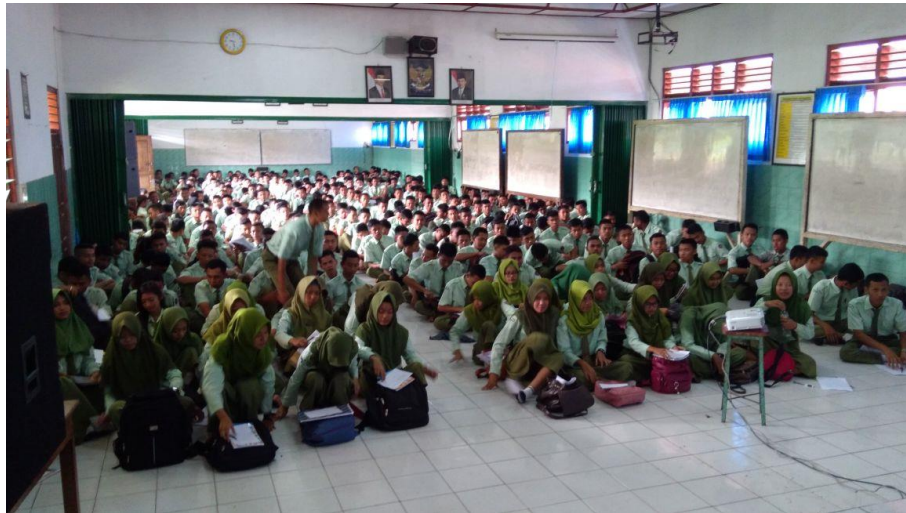
Gambar 2. Antusias Peserta dalam Mengikuti Pengabdian