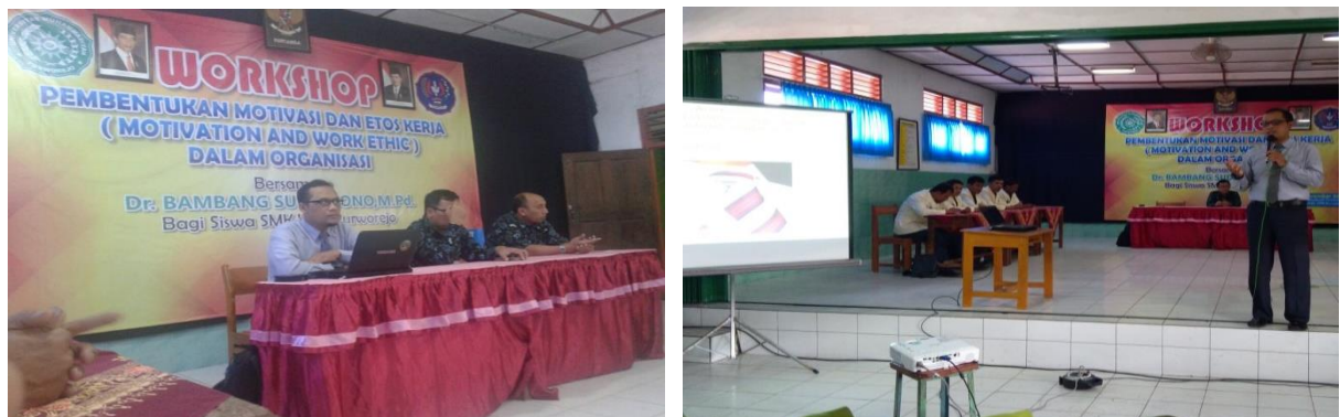
Gambar 1. Pemberian Materi Motivasi dan Materi

Tahap pelaksanaan ini meliputi penyampaian materi dan sesi tanya jawab atau diskusi interaktif. Penyampaian materi yang disampaikan adalah materi motivasi dan gambaran etos kerja yang dibutuhkan oleh dunia kerja/ industri.