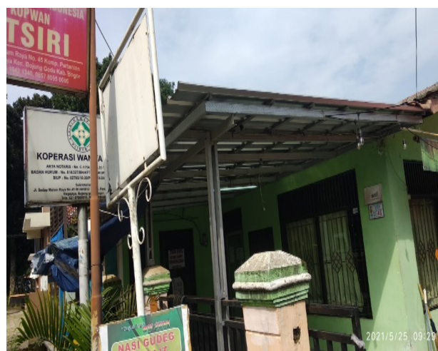
Gambar 1. Koperasi Wanita Atsiri Kab. Bogor

Atas dasar hal tersebut di atas maka kami selaku pihak akademisi bermaksud mengadakan kegiatan pengabdian masyarakat dalam bentuk " Optimalisasi Pemasaran Produk Lokal Melalui Workshop Desain Grafis dengan Canva pada Koperasi Wanita Atsiri Kab. Bogor". Pada gambar 1 lokasi untuk Koperasi Wanita Atsiri Kabupaten Boor di bawah ini: