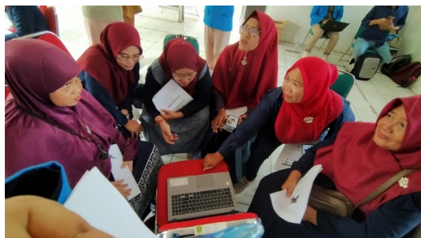
Gambar 3. langsung pelatihan kepada ibu ibu koperasi

Para ibu ibu anggota koperasi melakukan langsung pada palikasi yang di sediakan dengan laptob