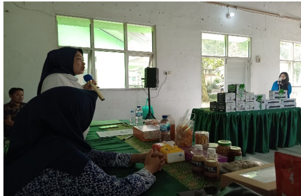
Gambar 2. Sambutan Ketua Koperasi Wanita Atsiri

Tahapan dokumentasi digunakan untuk mengumpulkan data dan bukti setelah dilakukan kegiatan pengabdian.