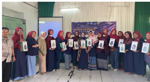
Gambar 5. Penyerahan Sertifikat Kepada ibu ibu koperasi

Foto bersama dan penyerahan sertifikat oleh ketua Pengabdian masyarakat Universits Nusa Mandiri: