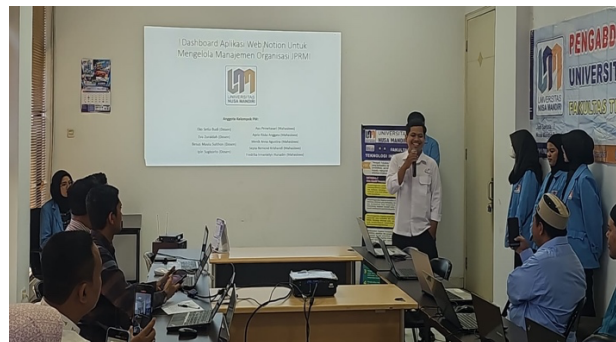
Gambar 2. Sambutan ketua JPRM DKI

Ketua JPRM memberikan sambutan kepada para peserta dan dosen: