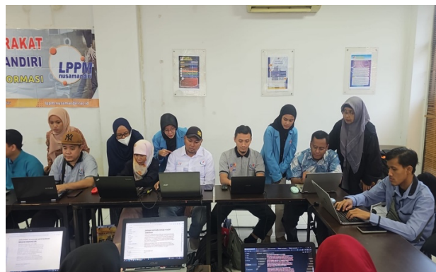
Gambar 4. Peserta langsung mempraktekkan aplikasi di bantu mahasiswa dan dosen Universitas Nusa Mandiri

Para peserta langsung mempraktekkan pada laptop yang tersedia oleh universitas Nusa Mandiri di dampingin oleh masiswa dan dosen: