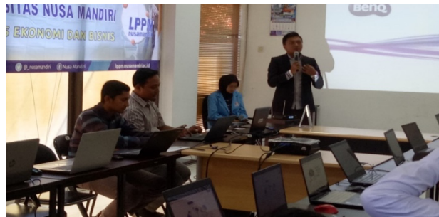
Gambar 1. Memberikan Sambutan dari Ketua pengabdian Masyarakat

Ketua JPRM memberikan sambutan kepada para peserta dan dosen: