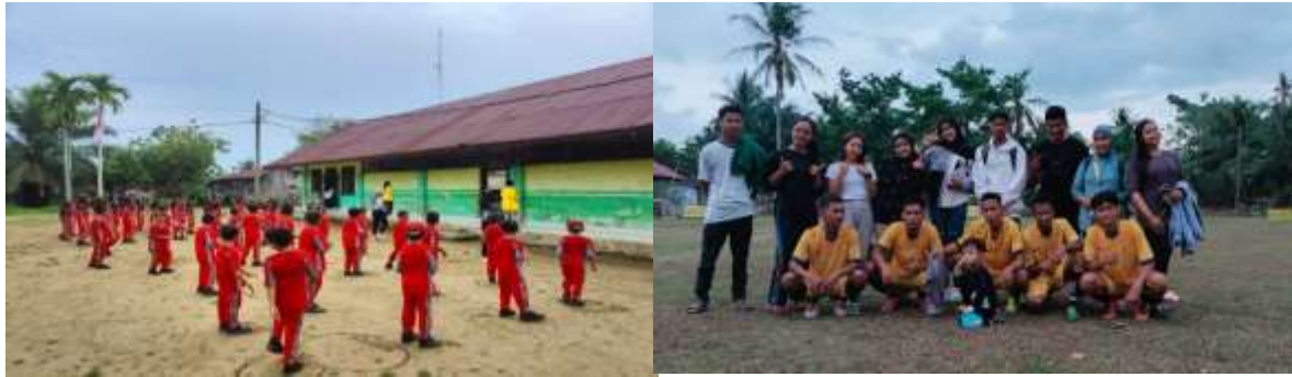
Gambar 1. Sekolah Dasar dan Tim Karang Taruna