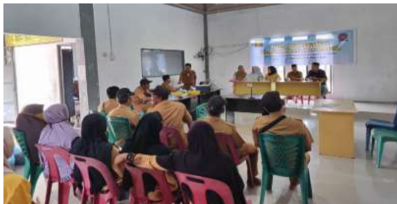
Gambar 3. Pelaksanaan Kegiatan

Peningkatan keterampilan dan pengetahuan masyarakat tersebut merupakan modal penting untuk meningkatkan perekonomian masyarakat desa dengan keterampilan dan pengetahuan yang dimiliki, masyarakat dapat menghasilkan produk dan jasa yang berkualitas sehingga dapat bersaing di pasar. Salah satu yang bisa dilakukan dalam kegiatan pengabdian Kepada Masyarakat yang bertema 'Peningkatan Kualitas SDM dan Perekonomian Masyarakat Melalui Pendidikan Berbasis Ekonomi Lokal, dengan memberikan sosialisasi dan pendampingan melalui ilmu pengetahuan dalam bidang akademik seperti memberikan pemahaman dan penguasaan soft skill untuk peningkatan kualitas sumber daya manusia. Hasil dari kegiatan ini menyimpulkan bahwa kegiatan ini sangat membantu peserta dalam peningkatan pemahaman dan kesadaran mereka dalam peningkatan soft skill dalam bidang pendidikan demi keberlangsungan hidup dan meningkatkan perekonomian masyarakat desa.