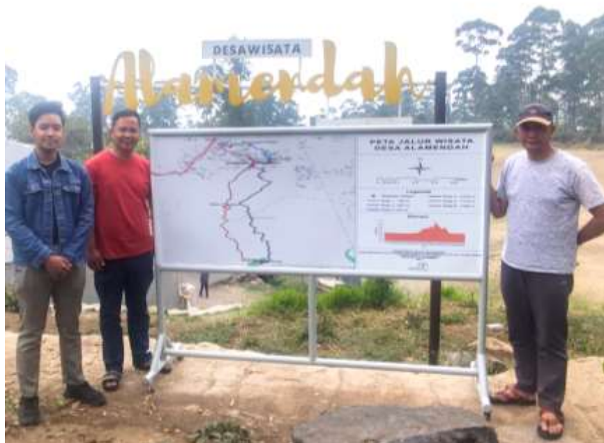
Gambar 7. Soft Launching Plang Peta Jalur Wisata Dawala

Pada tahap 4 ini, Peta Jalur Wisata Dawala sudah selesai dibuat dan telah siap untuk dipasang di Dawala. Soft Launching produk Peta Jalur Wisata dihadiri oleh Tim Pengelola Desa Wisata Alamendah dan perwakilan dari Universitas Pertamina.