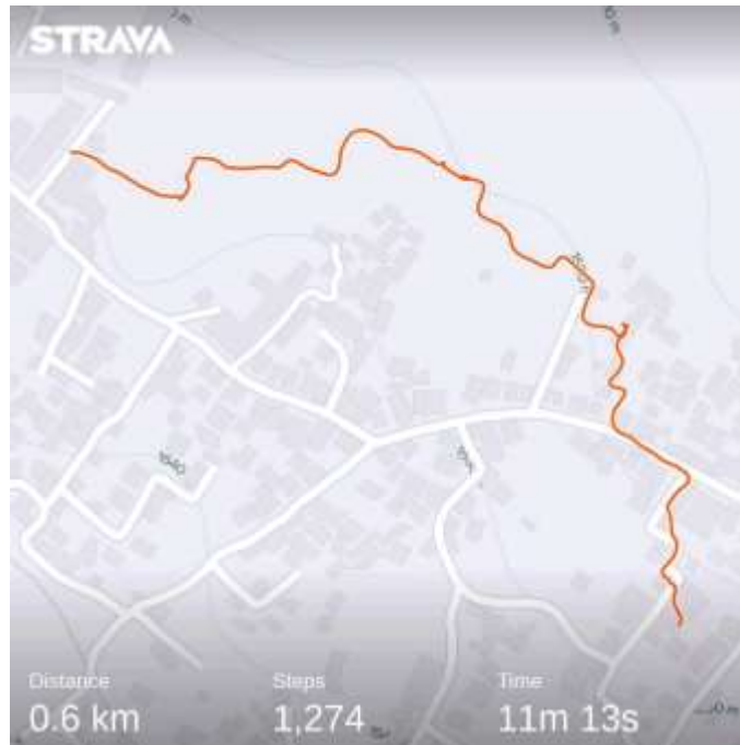
Gambar 4. Pendampingan Pembuatan Peta Jalur Wisata