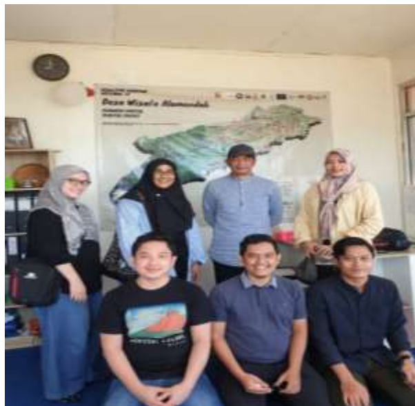
Gambar 3. Pendampingan Pembuatan Peta Jalur Wisata Dawala

Kegiatan dimulai dengan mengadakan sosialisasi teknik kegiatan pembuatan peta jalur wisata dengan pemangku kepentingan Dawala (pokdarwis, perangkat desa, masyarakat pengelola dan lainnya). Kegiatan ini sekaligus menyepakati waktu pelaksanaan kegiatan.