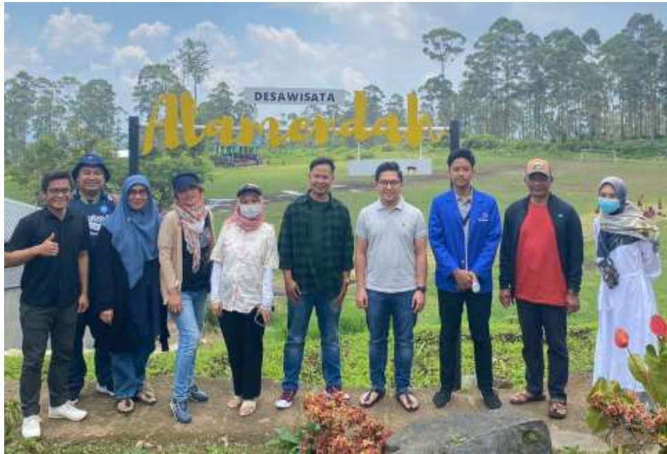
Gambar 2. Kegiatan Observasi dan Survei Awal