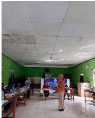
Gambar 3. Penyuluhan Pemasaran Digital

berkreasi membuat motif dengan melipat kemudiann di ikat menggunakan tali yang sudah di sediakan secara rapat dan kencang seperti gambar 5. Selanjutnya ke tahap pewarnaan.