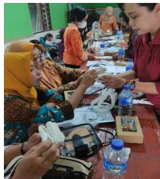
Gambar 5. Tahap Pembuatan Motif dan Pola

Tahap Pewarnaan. Teknik pewarnaan yang di gunakan dalam shibori yaitu teknik celup atau tie dye sesuai motif yang di inginkan seperti gambar 6. Macam Tie Dye ada: Mutiara Tie Dye ( motif seperti gelombang air dengan cara melonggarkan kain dengan memakai tali), Arashi Tie Dye (motif seperti hujan dengan cara di lilitkan ke pipa), Nui Tie Dye (bentuk motif megikuti garis pola jahitan), Itajime Tie Dye (motif kotak-kotak dengan cara menjepit kain dengan lembar kayu yag ujungnya diikat), Kumo Tie Dye (bentuk motif melingkar jaring laba-laba dengan cara mengikat merata di seluruh bagian kain) (Najihah et al, 2021). Pewarnaan menggunakan naphtol. Warna Biru dengan mencelupkan totebag ke dalam pewarna naphtol (ASD + kostik +TRO), kemudian di celup dengan garam pembangkit (Biru B). Warna merah dengan mencelupkan ke dalam pewarna nahtol (ASD + kostik + TRO) dan kemudian di celup dengan garam pembangkit (Merah B). Warna kuning dengan mencelupkan ke dalam naphtol (ASG +kostik + TRO) dan kemudian di celup ke garam pembangkit ( Biru B atau Merah ). Ketika sudah di celupkan sesuai motif yang di inginkan diamkan beberapa menit tas tottebag hingga tidak menetes menyerap maksimal, lepas tali dan di angin-anginkan beberapa menit jangan di bawah matahari langsung agar warna melekat kuat pada kain lalu bisa di bilas dengan air biasa dan di jemur di tempat yang tidak terkena matahari langsung seperti gambar 7. Tas tottebag sudah kering disetrika rapi sudah siap untuk di pasarkan seperti gambar 8.