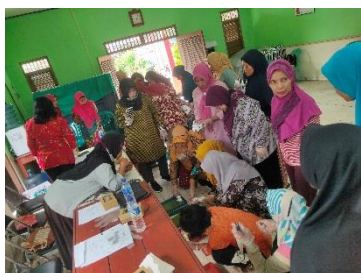
Gambar 6. Tahap Pewarnaan

Tahap Pewarnaan. Teknik pewarnaan yang di gunakan dalam shibori yaitu teknik celup atau tie dye sesuai motif yang di inginkan seperti gambar 6. Macam Tie Dye ada: Mutiara Tie Dye ( motif seperti gelombang air dengan cara melonggarkan kain dengan memakai tali), Arashi Tie Dye (motif seperti hujan dengan cara di lilitkan ke pipa), Nui Tie Dye (bentuk motif megikuti garis pola jahitan), Itajime Tie Dye (motif kotak-kotak dengan cara menjepit kain dengan lembar kayu yag ujungnya diikat), Kumo Tie Dye (bentuk motif melingkar jaring laba-laba dengan cara mengikat merata di seluruh bagian kain) (Najihah et al, 2021). Pewarnaan menggunakan naphtol. Warna Biru dengan mencelupkan totebag ke dalam pewarna naphtol (ASD + kostik +TRO), kemudian di celup dengan garam pembangkit (Biru B). Warna merah dengan mencelupkan ke dalam pewarna nahtol (ASD + kostik + TRO) dan kemudian di celup dengan garam pembangkit (Merah B). Warna kuning dengan mencelupkan ke dalam naphtol (ASG +kostik + TRO) dan kemudian di celup ke garam pembangkit ( Biru B atau Merah ). Ketika sudah di celupkan sesuai motif yang di inginkan diamkan beberapa menit tas tottebag hingga tidak menetes menyerap maksimal, lepas tali dan di angin-anginkan beberapa menit jangan di bawah matahari langsung agar warna melekat kuat pada kain lalu bisa di bilas dengan air biasa dan di jemur di tempat yang tidak terkena matahari langsung seperti gambar 7. Tas tottebag sudah kering disetrika rapi sudah siap untuk di pasarkan seperti gambar 8.