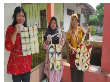
Gambar 8. Produk Jadi Siap Jual