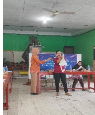
Gambar 4. Penyuluhan Teknik Shibori