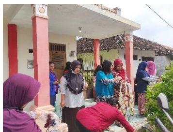
Gambar 7. Tahap Pewarnaan