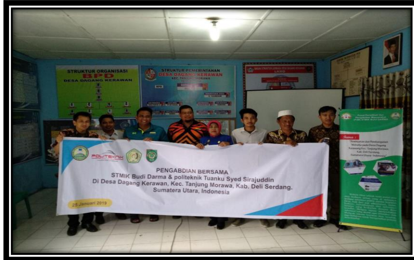
Gambar 2. Foto Pelaksanaan Kegiatan