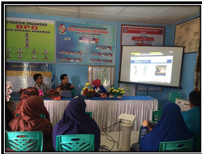
Gambar 4. Foto Pelaksanaan Kegiatan