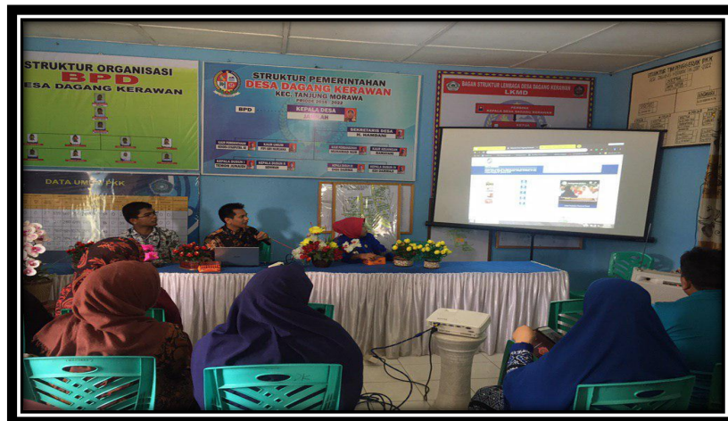
Gambar 3. Foto Pelaksanaan Kegiatan