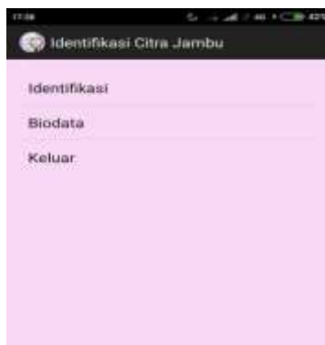
Gambar 3. Tampilan Halaman Menu Utama

Tampilan input berupa tampilan masukkan yang dapat diinput oleh user, berikut ini tampilan dari menu input. Tampilan menu utama merupakan tampilan awal pada aplikasi yang penulis bangun, pada tampilan menu utama ini terdapat 3 pilihan menu yaitu Menu Identifikasi, Menu biodata dan menu keluar. Tampilan menu utama adalah seperti gambar dibawah berikut.