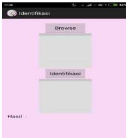
Gambar 4. Tampilan Halaman Identifikasi

Tampilan output berupa tampilan keluaran yang dihasilkan oleh aplikasi dengan melakukan metode ekstraksi ciri statistik . Output pada aplikasi ini akan menghasilkan gambar berupa hasil identifikasi dari gambar jambu madu. Pada halaman ini akan menghasilkan output berupa hasil gambar yang diidentifikasi dan keterangan berupa hasil dari identifikasi. Adapun tampilan output seperti gambar dibawah berikut.