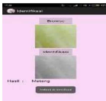
Gambar 6. Tampilan Output hasil Identifikasi

Hasil yang didapat pada perancangan aplikasi ini adalah berupa hasil gambar yang telah diidentifikasi dan keterangan berupa kematangan dari jambu madu. Adapun tampilan hasilnya adalah seperti gambar dibawah berikut.