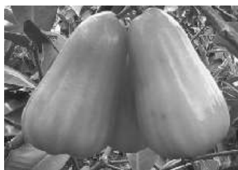
Gambar 2. Jambu Madu Grayscale