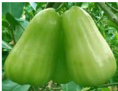
Gambar 1. Jambu Madu Asli

Sebelum melakukan proses testing , perlu dilakukan proses training . Dimana pada proses ini dilakukan proses penajaman citra, konversi citra ke grayscale .