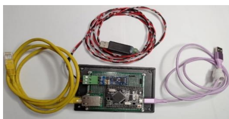
Gambar 4. Foto perangkat keras dengan konektor