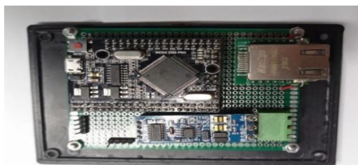
Gambar 3. Foto produk perangkat keras

Perangkat keras di realisasikan menggunakan mikrokontroler ATMEGA2560 yang berupa modul Arduino Mega Pro, Interface ke ethernet menggunakan modul mini Wiznet W5500 dan sebuah modul konverter serial TTL to serial RS485, berbasis IC max485. Secara visual ditunjukkan pada gambar 3 dan 4.