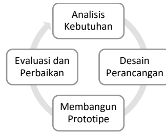
Gambar 1. Metodologi Penelitian

Tahapan awal yaitu analisis kebutuhan, kemudian perancangan desain. Setelah menganalisis kebutuhan sistem, selanjutnya melakukan perancangan desain ini terkait dari perancangan sistem yang diusulkan seperti diagram blok sistem, perancangan perangkat keras dan perancangan perangkat lunak. Pada perancangan perangkat keras, akan dijelaskan komponen pembentuk prototipe. Dan terakhir perancangan perangkat lunak terkait perangkat penunjang.