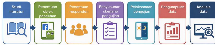
Gambar 1. Tahapan Penelitian