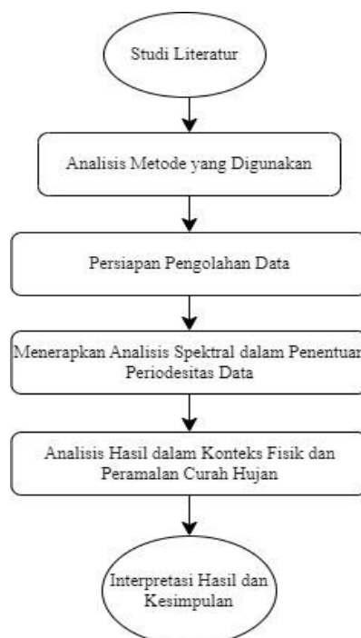
Gambar 1. Tahapan penelitian

Penelitian ini menggunakan pendekatan kuantitatif dengan analisis spektral sebagai metode utama. Tahapan penelitian dapat dilihat pada Gambar 1.