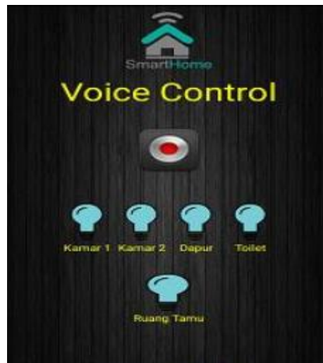
Gambar 5. Tampilan Voice Control

Tahap selanjutnya menjalankan aplikasi smart home dengan mode voice control. Pada percobaan mode touch control, pengujian dilakukan dengan menggunakan suara yang berupa kalimat-kalimat yang telah di tentukan sebelumnya.