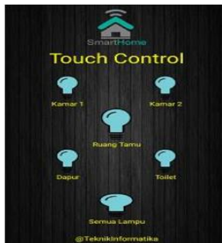
Gambar 4. Tampilan touch control

Tahap percobaan pertama menjalankan aplikasi smart home dengan mode touch control. Pada percobaan aplikasi smart home mode touch control ketika salah satu tombol ditekan maka tombol akan berubah warna menjadi kuning yang menandakan lampu menyala.