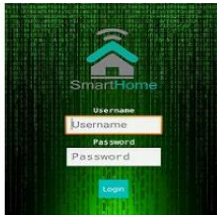
Gambar 3. Tampilan Awal

Dibawah ini merupakan tampilan awal ketika program dijalankan.