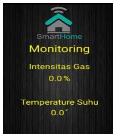
Gambar 7. Tampilan Monitoring Gas dan Suhu

Tahap selanjutnya menjalankan aplikasi smart home dengan fungsi monitoring dua. Pada percobaan aplikasi smart home fungsi monitoring dua, aplikasi dapat membaca output dari sistem yang berupa monitoring intensitas gas dan temperature suhu.