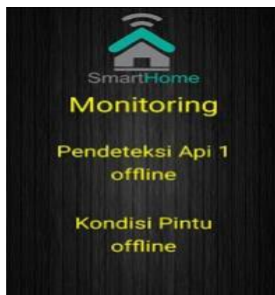
Gambar 6. Tampilan Monitoring Api dan Pintu

Tahap selanjutnya menjalankan aplikasi smart home dengan fungsi monitoring satu. Pada percobaan aplikasi smart home monitoring satu, aplikasi dapat membaca output dari sistem yang berupa monitoring pintu dan identifikasi kebakaran.