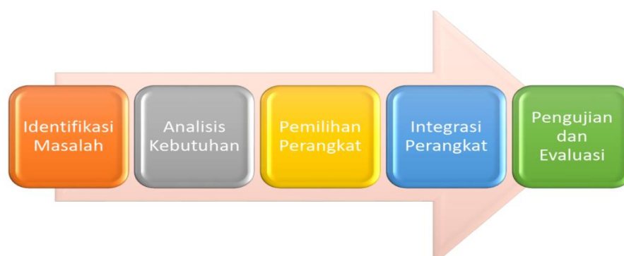
Gambar 1. Kerangka Tahapan Penelitian

Dalam melakukan pendekatan pemecahan masalah untuk Smart Home Berbasis Internet of Things (IoT), penting untuk melibatkan penghuni rumah dan mempertimbangkan faktor keamanan. Penggunaan teknologi IoT yang cerdas dan efektif dapat memberikan kenyamanan dan keamanan yang lebih baik di rumah, dan dapat mengoptimalkan pengalaman hidup sehari-hari.