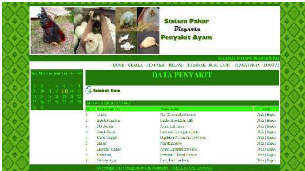
Gambar 6. Tampilan Halaman Data Penyakit

Halaman data penyakit berisi nama penyakit ayam berikut dengan deskripsi dan juga solusinya baik itu pengobatan atau pencegahan penyakit. Tampilan halaman penyakit seperti pada Gambar 6