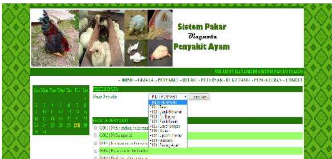
Gambar 7. Tampilan Halaman Relasi

Halaman relasi merupakan tempat dimana data penyakit dan data gejala direlasikan. Untuk membentuk relasi gejala dengan penyakit, admin memilih nama penyakit terlebih dahulu lalu melakukan check list pada gejala. Tampilan halaman relasi adalah sebagai berikut: