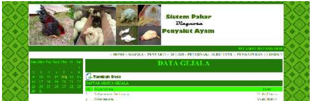
Gambar 5. Tampilan Halaman Gejala

Halaman gejala merupakan halaman yang berisi daftar semua gejala yang tersimpan di tabel gejala dalam database. Gejala merupakan fakta-fakta yang dimasukkan ketika melakukan diagnosa penyakit.