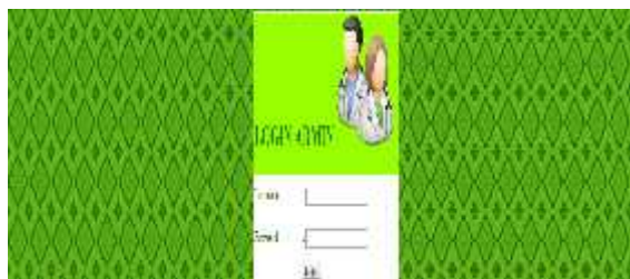
Gambar 3. Tampilan Halaman Login Admin

Halaman ini berisi mengenai file-file yang dapat diakses oleh admin, mengenai pengolahan data basis pengetahuan yaitu data gejala dan data penyakit, pengolahan data basis aturan, dan data admin sendiri. Akan dijelaskan sebagai berikut: