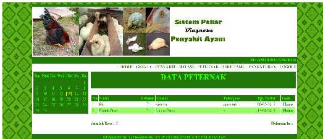
Gambar 8. Tampilan Halaman Data Peternak

Halaman data peternak merupakan halaman yang berisi data peternak yang sudah mendaftar di dalam sistem pakar.