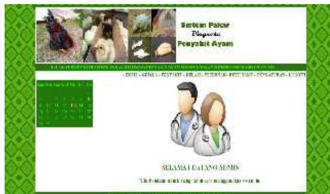
Gambar 4. Tampilan Halaman Utama Admin

Halaman ini merupakan tampilan utama ketika admin sudah melakukan login kedalam sistem. Halaman utama admin terlihat seperti gambar dibawah ini.