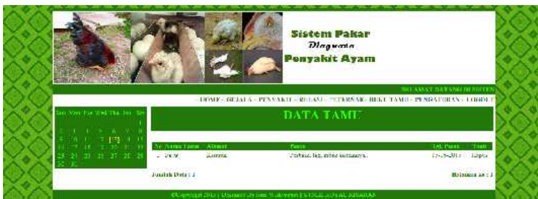
Gambar 9. Tampilan Halaman Buku Tamu

Halaman buku tamu merupakan halaman yang berisi data tamu yang telah mengirim pesan ke dalam sistem. Perintah yang dapat di akses admin pada buku tamu yaitu perintah hapus. Tampilan halaman buku tamu seperti pada gambar 9