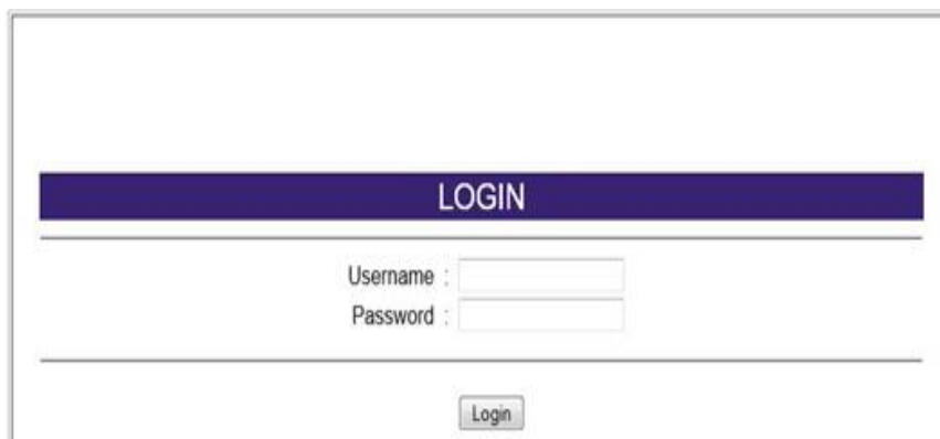
Gambar 3. Form Login

Saat admin mau operasikan aplikasi ini terlebih dahulu harus melakukan login, dimana pada saat login harus memasukkan nama user dan password yang sesuai dengan nama user dan password yang sudah di input di form admin dan tersimpan di database, ketika user memasukkan username dan password yang salah maka pada saat ditekan tombol login axkan muncul pesan “USER NAME ATAU PASSWORD SALAH” dan ketika user memasukkan user name dan password benar maka akan muncul pesan “LOGIN SUKSES” dan semua menu admin akan aktif