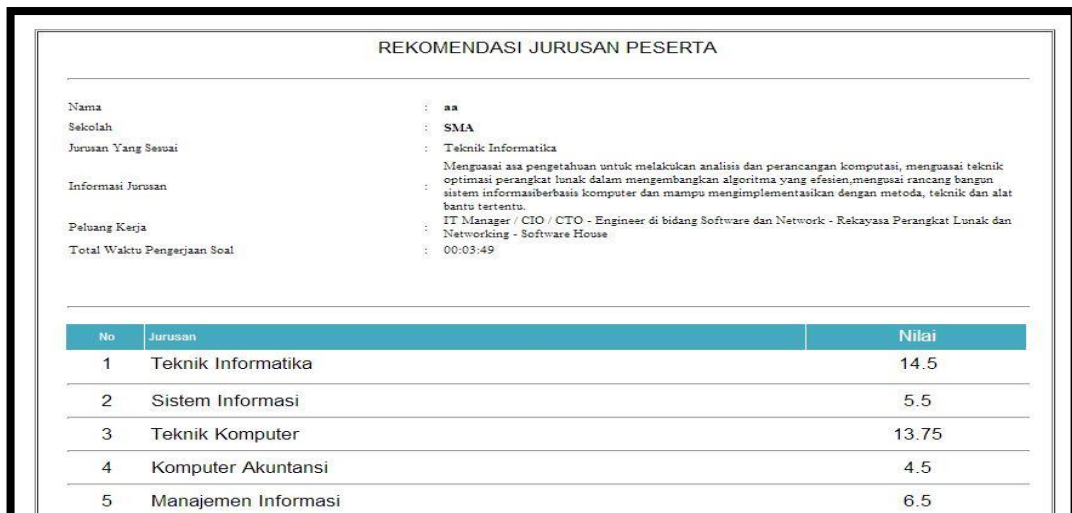
Gambar 9. Form Nilai Ujian

Pada form ini akan ditampilkan hasil dari simulasi ujian yang telah dikerjakan.