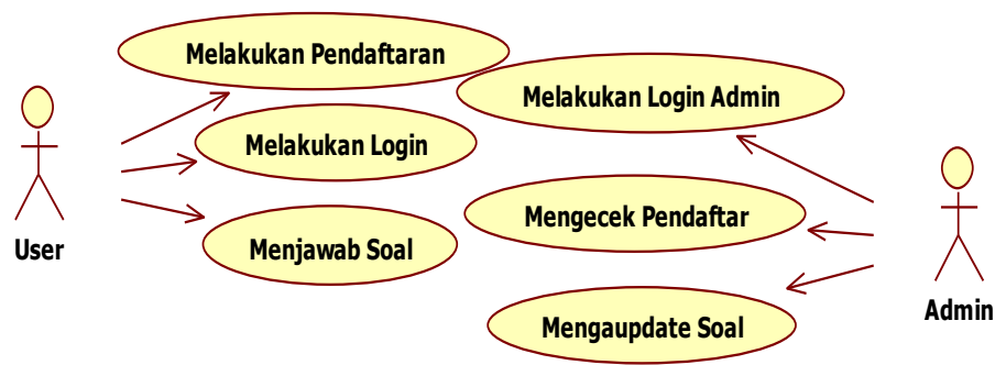
Gambar 2. Use Case diagram

Use case adalah sebuah teknik dalam pengembangan perangkat lunak untuk mendefinisikan interaksi antara pengguna (user) dengan sistem. Use case digunakan untuk menggambarkan aktivitas yang dilakukan oleh pengguna dan memberikan gambaran mengenai bagaimana sistem akan bekerja dalam mengatasi kebutuhan pengguna [19]. Use case atau diagram use case merupakan pemodelan untuk kelakuan (behavior) sistem informasi yang akan dibuat [20]. Dalam use case, akan didefinisikan beberapa elemen penting seperti aktor, aksi, dan respons sistem. Aktor adalah pihak yang terlibat dalam interaksi dengan sistem, bisa berupa pengguna atau pihak lain yang membutuhkan hasil dari sistem. Aksi adalah kegiatan yang dilakukan oleh pengguna atau sistem dalam menjalankan fungsi-fungsi tertentu. Sedangkan respons sistem adalah respons yang diberikan oleh sistem terhadap aksi pengguna. Use Case mendeskripsikan kumpulan urutan dimana setiap urutan menjelaskan interaksi dengan yang ada di luar sistem atau biasa disebut dengan actor. Dalam konteks ini peneliti memilih calon mahasiswa (user) sebagai actor. Berikut ini use case diagram yang menggambarkan kegiatan.