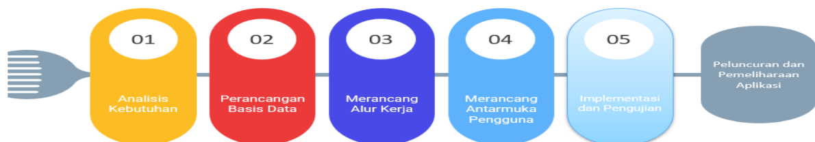
Gambar 2. Tahapan Penelitian

Perancangan aplikasi sistem penentuan program studi berbasis online dapat dilakukan dengan langkah-langkah berikut: