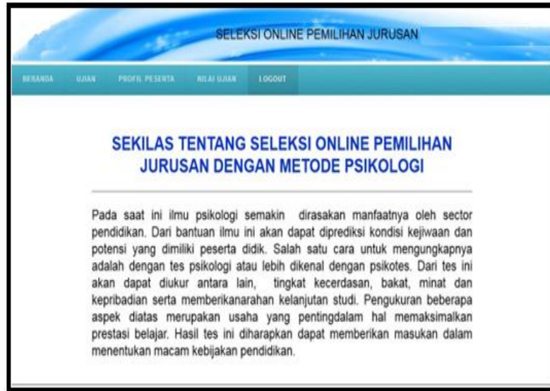
Gambar 3. Halaman Beranda

Untuk menjalankan aplikasi ini dapat akses di web browser dengan mengetikkan alamat http://localhost/uo seperti gambar dibawah ini :