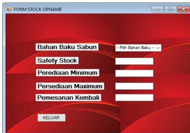
Gambar 4. Tampilan Form Stock Opname

Tampilan Form Stock Opname adalah tampilan yang akan muncul ketika Input data di klik. Adapun tampilan Form Stock Opname dapat dilihat pada gambar di bawah ini: