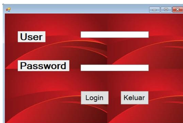
Gambar 1. Tampilan Menu Admin

Tampilan menu admin adalah tampilan yang akan muncul pertama kali ketika aplikasi dijalankan. User admin yang sudah terdaftar didalam database akan dapat login secara langsung, sedangkan user admin yang tidak terdaftar di dalam database maka tidak dapat login kedalam sistem aplikasi ini, maka aplikasi akan langsung menolak. Pada form ini user admin diharuskan menginputkan nama dan password yang merupakan kunci untuk membuka aplikasi dan menampilkan form utama. Adapun tampilan menu login dapat dilihat pada gambar di bawah ini: