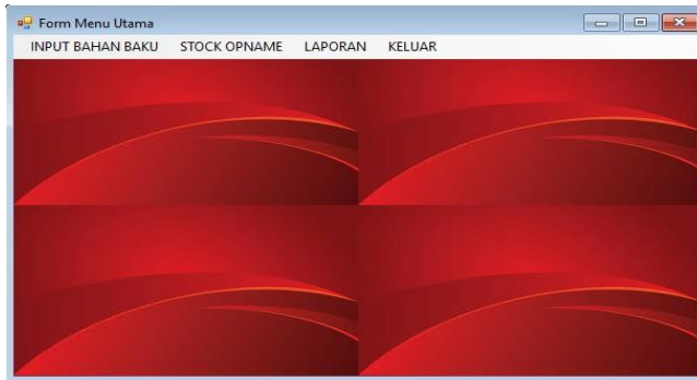
Gambar 3. Tampilan Menu Utama

Tampilan Form Input Data adalah tampilan yang akan muncul ketika Input data di klik. Adapun tampilan Form Input Data dapat dilihat pada gambar di bawah ini: