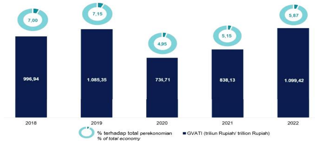
Gambar 1. Kontribusi GVATI terhadap Perekonomian Indonesia, 2018–2022

Gambar 1 menunjukkan bahwa selama pandemi COVID-19, kontribusi Gross Value Added Tourism Industries (GVATI) terhadap perekonomian Indonesia telah berubah secara signifikan, dengan dampak yang signifikan pada berbagai sektor. Gambar 1 menunjukkan bahwa kontribusi sektor pariwisata menurun drastis pada tahun 2020. Namun, pada tahun 2022, pangsa GVATI meningkat menjadi 5,87 persen. Untuk mempercepat pemulihan sektor pariwisata nasional, pemerintah telah menetapkan lima destinasi prioritas: Borobudur, Danau Toba, Likupang, Mandalika, dan Labuan Bajo. Langkah-langkah ini mencakup peningkatan jumlah wisatawan, penambahan jumlah objek wisata, serta peningkatan tingkat penghuni kamar (Badan Pusat Statistik Provinsi Sumatera Utara, 2024).