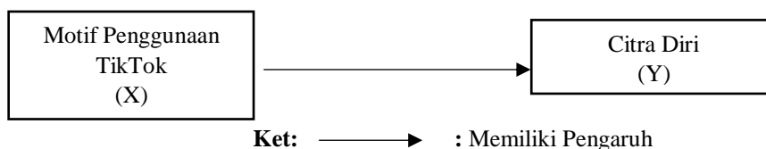
Gambar 1. Kerangka Dasar Penelitian

Dari gambar tersebut, dijelaskan bahwa Motif Penggunaan merupakan salah satu faktor yang dapat mempengaruhi Citra Diri Pengguna. Motif penggunaan media merupakan dorongan dari dalam diri manusia yang timbul atas dasar sifat ingin memenuhi kebutuhan yang ingin dipenuhi. Semua tingkah laku yang meliputi pergerakan, berbagai macam alasan dan dorongan yang menyebabkan seseorang melakukan sesuatu. Menurut (Rarasingtyas & Maturbongs, 2019) bahwa motif penggunaan media berpengaruh terhadap citra diri. Beberapa faktor yang melatarbelakangi penggunaan aplikasi TikTok diantaranya faktor pengetahuan, faktor hiburan, dan faktor ekonomi (Mahardika et al., 2021). Citra diri adalah sikap seseorang terhadap tubuhnya secara sadar dapat berupa persepsi, perasaan mengenai ukuran dan bentuk penampilan hingga potensi tubuh pada masa lalu yang telah berubah dengan masa saat ini. Citra diri dipengaruhi oleh performa individu itu sendiri (Mangkuprawira & Hubeis, 2007).