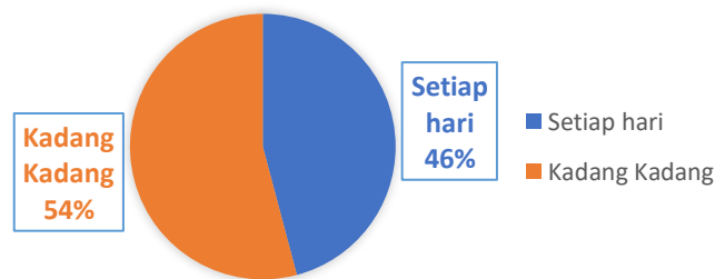
Gambar 3. Karakteristik Intensitas Pengguna

Berdasarkan tabel 7, mahasiswa yang mengisi kuesioner kebanyakan ialah dari Angkatan 2022 dengan jumlahnya sebanyak 39 orang. Hal ini mengidentifikasi mahasiswa yang menjadi responden tersebut sangat ingin mengisi kuesioner yang disebar melalui link google form dan menggunakan aplikasi TikTok. Langkah selanjutnya yaitu intensitas pengguna yaitu: