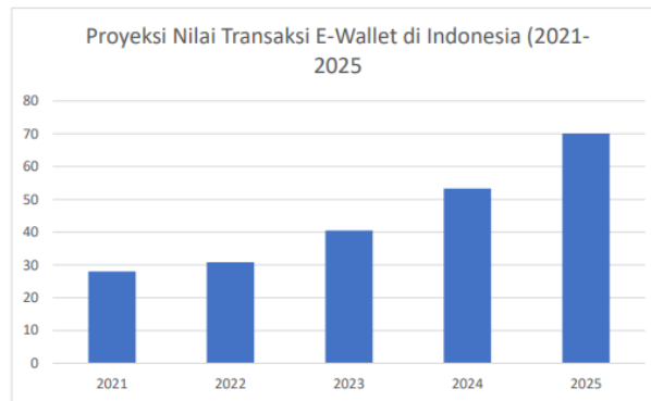
Gambar 1. Proyeksi Nilai Transaksi E-wallet

Selain itu, penggunaan media sosial yang berlebih ini dapat memberikan dampak pada pengguna-penggunanya khususnya para remaja di Indonesia. Menggunakan media sosial sendiri dapat memberikan dampak yang positif pada penggunaannya, yaitu dapat melakukan komunikasi serta berhubungan dengan mudah dan simpel serta dapat menambah teman. Akan tetapi, ketika sering menggunakan media sosial juga akan memunculkan iklan dari suatu produk. Hal inilah yang selanjutnya dapat berdampak kepada keinginan seseorang untuk membeli produk tersebut. Perilaku konsumtif merujuk pada seseorang yang mengeluarkan uang secara berlebihan baik sadar maupun tidak sadar terhadap sebuah produk, jasa atau brand dan akan berkelanjutan (Fungky et al., 2022).