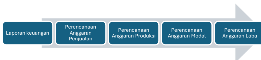
Gambar 3. Desain Model Perencanaan

Pemanfaatan laporan keuangan dalam perencanaan usaha didesain dengan model perencanaan pada Gambar 3 meliputi: