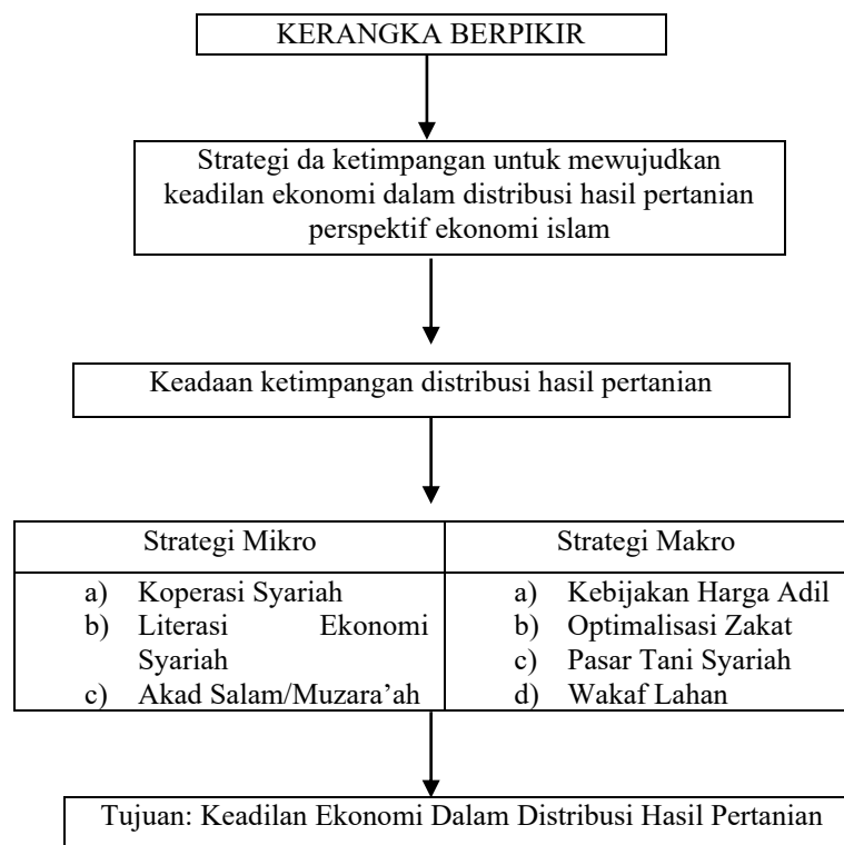
Gambar 1. Kerangka Berpikir Penelitian

Kerangka berpikir dalam penelitian ini dibangun dari keterkaitan antara konsep distribusi, keadilan ekonomi, dan ekonomi Islam. Ketimpangan distribusi hasil pertanian menjadi latar belakang permasalahan utama yang dianalisis melalui pendekatan dua sisi, yaitu strategi mikro berupa penguatan lembaga distribusi syariah seperti koperasi tani dan penerapan akad syariah seperti muzara'ah, serta strategi makro yang mencakup kebijakan fiskal daerah melalui alokasi anggaran APBD. Keseluruhan strategi ini ditujukan untuk menciptakan sistem distribusi yang berkeadilan bagi petani dan konsumen. Kerangka ini divisualisasikan dalam Gambar 1 sebagai bentuk representasi logis hubungan antarvariabel dan sebagai pemenuhan panduan jurnal yang mewajibkan adanya diagram kerangka berpikir. Berikut disajikan Kerangka Berpikir yang menunjukkan hubungan antara ketimpangan distribusi, pendekatan ekonomi Islam, dan strategi kebijakan yang diusulkan untuk mewujudkan keadilan ekonomi dalam distribusi hasil pertanian di Kota Medan.