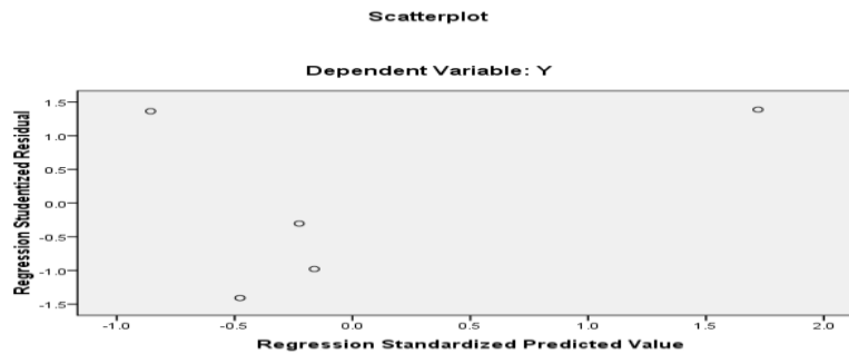
Gambar 2. Hasil Uji Heterokedastisitas

Dari Gambar Scatterplot di atas menunjukkan bahwa tidak terjadi heteroskedastisitas pada penelitian ini karena titik-titik tidak membentuk pola tertentu dan titik-titik tersebut menyebar diatas dan dibawah nol (0) pada sumbu Y, sehingga model regresi pada penelitian ini layak dipakai untuk memprediksi variabel Y (Harga Saham) berdasarkan masukan variabel independen Pertumbuhan Penjualan dan Deviden.