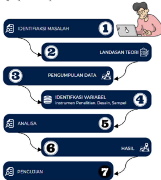
Gambar 1. Tahapan Penelitian

Dari gambar 1. terdapat beberapa tahapan yang dilakukan yaitu” identifikasi masalah, landasan teori, identifikasi variabel, analisa, hasil dan pengujian. Adapun penjelasan kegiatan yang dilakukan adalah sebagai berikut: