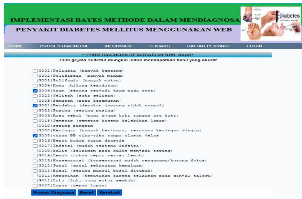
Gambar 7. Halaman Proses Diagnosa

Halaman proses diagnosa merupakan halaman pasien melakukan pemilihan gejala yang dialami pasien pada sistem yang memberikan tampilan pilhan gejala. Tampilan proses diagnonsa seperti pada gambar 7.