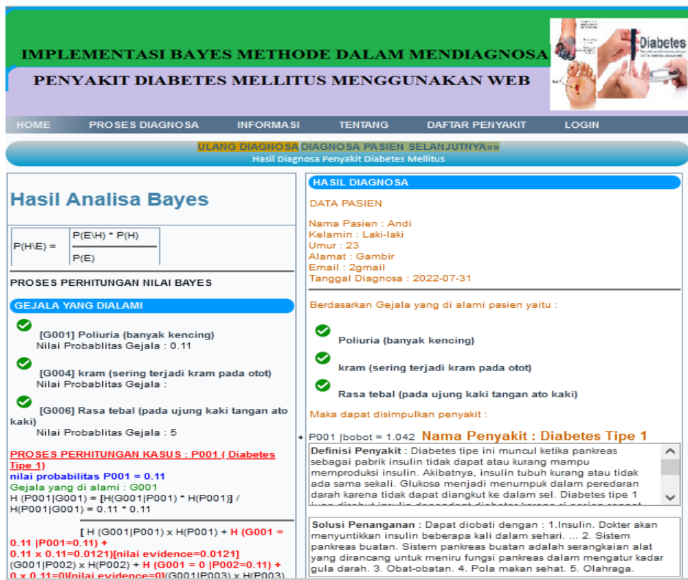
Gambar 8. Halaman Hasil Proses Diagnosa

Halaman hasil digunakan untuk menampilkan hasil dari proses diagnosa penyakit. Adapun tampilannya dapat dilihat seperti gambar 8.