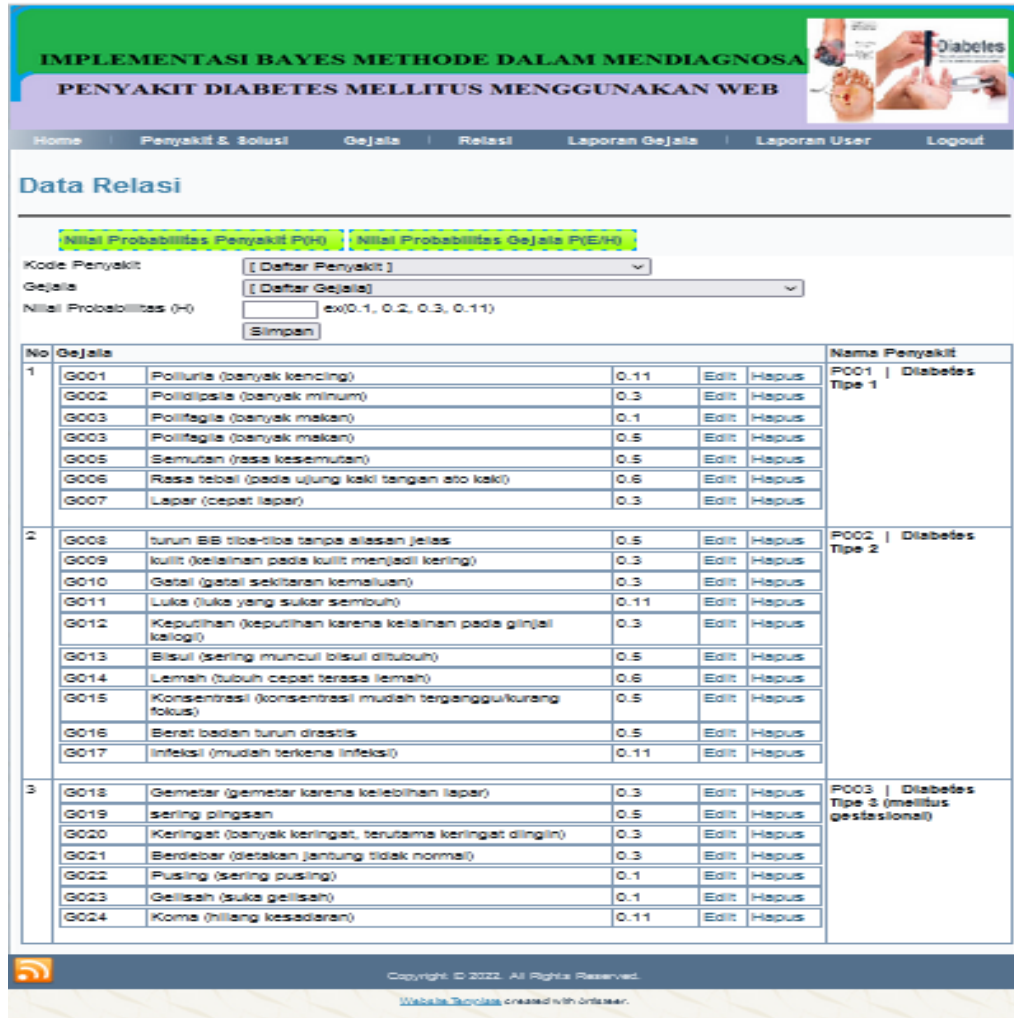
Gambar 6. Form Input Data Rule