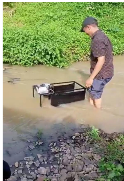
Gambar 3. Pengujian Alat di atas Permukaan Air

Posisi turbin terhadap debit dan kedalaman aliran air berpengaruh pada kecepatan putaran turbin. Pengujian mekanikal dilakukan dengan beberapa posisi turbin pada permukaan aliran air dan kedalaman aliran air untuk mendapatkan putaran turbin yang lebih baik. Beberapa posisi turbin pada permukaan sampai kedalaman aliran air secara horisontal.